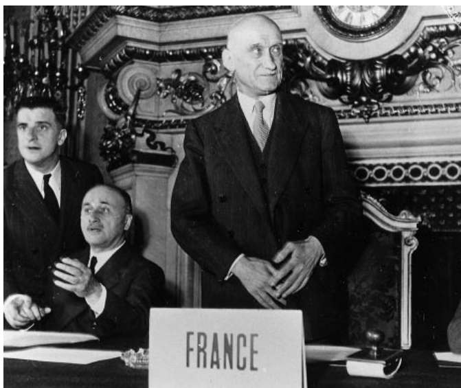
R. Schuman e J. Monnet

Come si può vedere, questo processo è più lungo da spiegare che